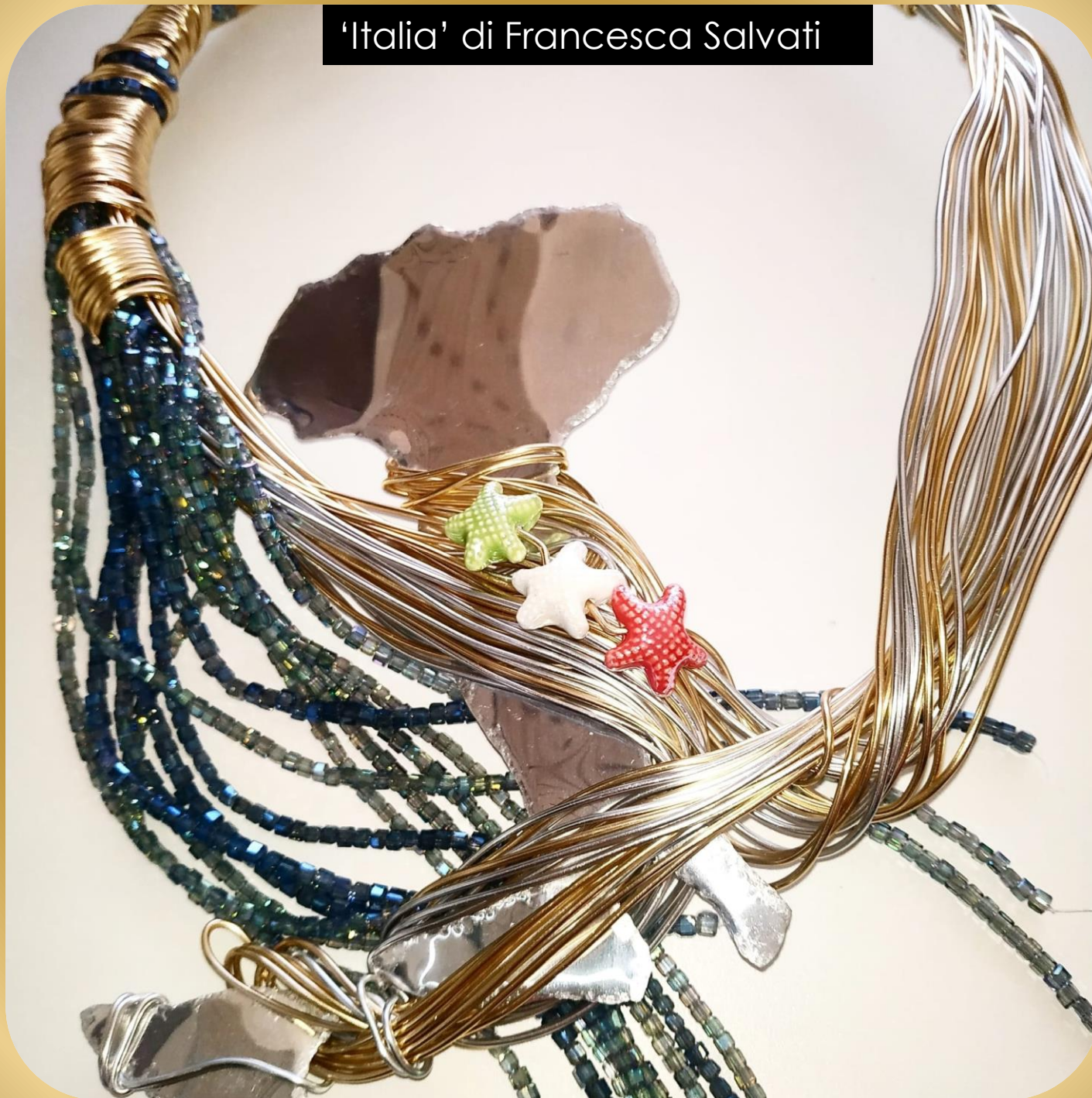
'Italia' di Francesca Salvati