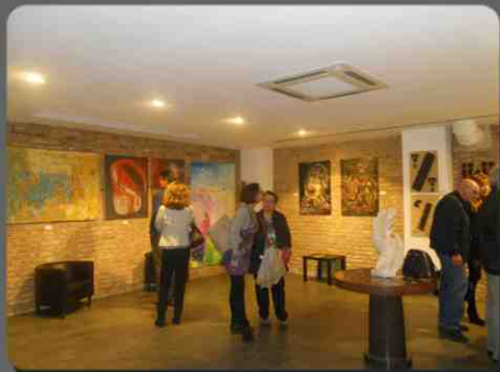
Sala Esposizione. a sin. Arch. Dionisio Magni