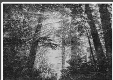
Gloria Cianchi Bagnati dal sole