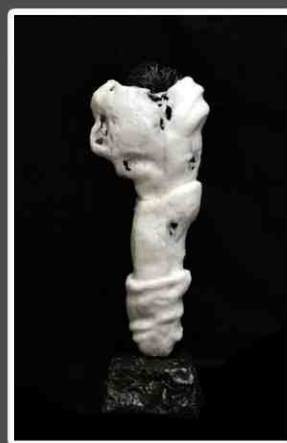
Meletios Meletiou Transition