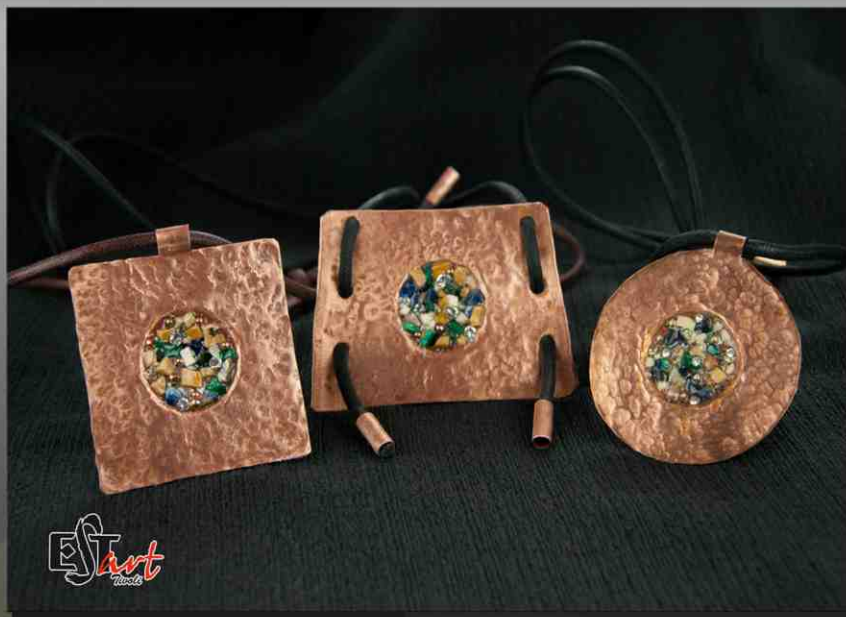
Rita Celanetti Estart "Gioielli"