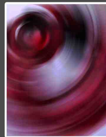
Debora Sorrenti Salomè