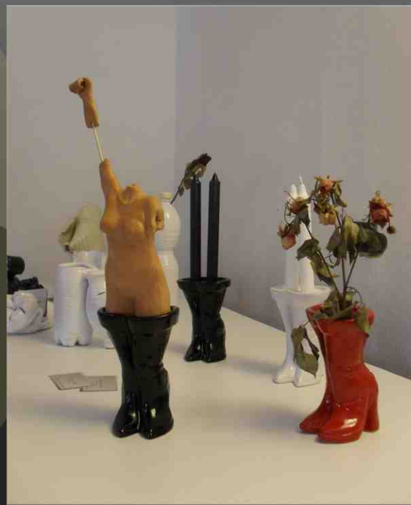
Antonella Conte Ceramica "Camminando"