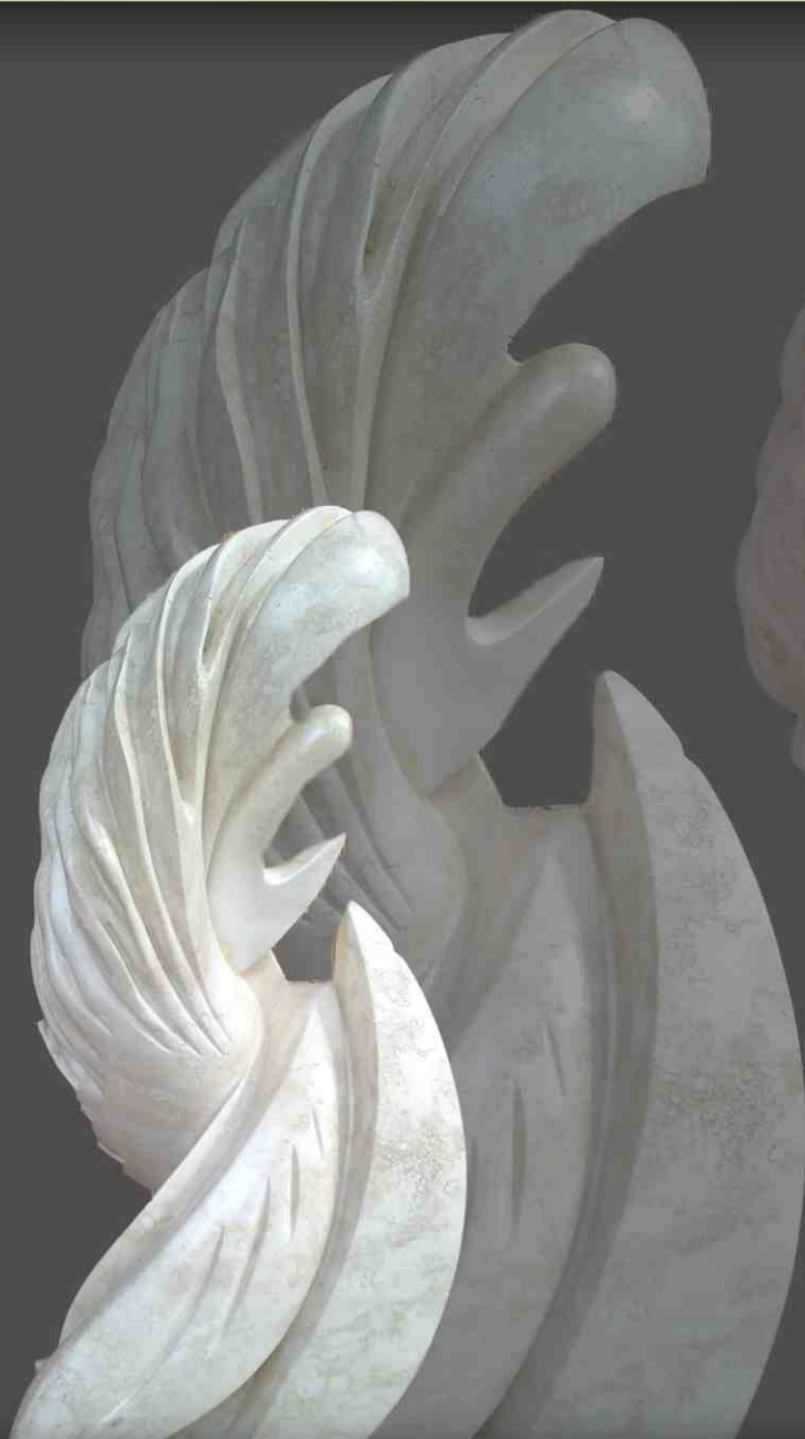
Silvio Cilli Eterometabolia cm. 50 x25 x 80