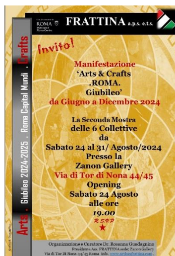
Locandina seconda collettiva dal 24/al 31/Agosto